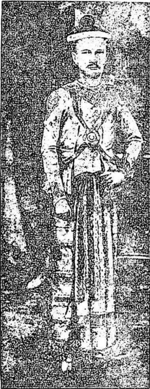
အလောင်းမင်းဘုရားကြီး။

အလောင်းဘုရားကြီး၏ ဘွားရာဇာတိ ချက်မြုပ်မှာ မုဆိုးဘို (ယခုရွှေဘိုဖြစ်သည်) မုဆိုးဘိုရွာ ခေါ်ခြင်းကား၊ ပုဂံပြည်နှင့် ဘုရင် အလောင်းစည်သူသည်။ မြင်းခွါတောင်မှစ၍ စီးဆင်း လာသော မူးချောင်းကို ပြင်ဆင်ပြီး လျှင်မြေတူးမှစ၍ သက်နက်ဘောင်တော်နှင့် ရွှေဘိုတိုင်အောင်စုံဆင်းလေသည်။ ရွှေဘိုကျ ရောက်သည့်အခါ ရွှေတစာဘုရားကို တည်လေသည်။ ထိုဘုရားတည်သောနေရာ၌ မုဆိုးအဖြစ်ဖြင့် အသက်မွေးသော မုဆိုး ငဘိုကို ထိုဘုရားအနီးရှိလယ်မြေ ယာမြေနှင့် တကွ လုပ်ကိုင်စားသောက်ရန် ကျွဲနွားနှင့် စရိတ်ငွေပါ ပေးသနားတော်မူပြီးလျှင် ထိုဘုရားကို ကြည့်ရှုရန်ခိုင်းတော်မူလေသည်။ မုဆိုး ငဘိုကိုအစွဲပြု၍ ၎င်းရွာကို မုဆိုး ငဘိုရွာဟုခေါ်ကြလေသည်။ ကာလရွေ့လျော သည့်အခါ မုဆိုးဘိုရွာဟုခေါ်ကြလေသည်။ ထိုရွာသည် တစတစကြီး၍လာပြီးလျှင် မြို့အဖြစ်သို့ရောက်လေ၏။ ထိုရွာသည်မူးဆိပ်ကမ်း၌ တည်၏။ မူးချောင်းထဲက သဲများကို ဆယ်တင်၍ ကမ်းဘောင်ရိုးလုပ်ပြီးလျှင် ထိုနေရာ၌ မူလတည်ရှိသောမုဆိုးဘိုရွာကိုချဲ့၏။ သို့ဖြစ်၍မုဆိုးဘိုရွာသည်ဖြစ်သည့်အခါကုန်းဘောင်ဟုခေါ်တွင်