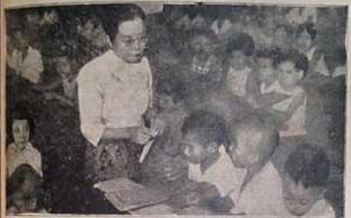
မညာရေးလောကတွင် ဆရာမဦးရေသည် ဆရာဦးရေထက် ပိုများသည်။

အိမ်သားများ အား သောက်စရာ အတွက် ဝယ်ခြင်း ချက် ပြုတ် ရသည့် တာဝန်မှာ အ မျိုးအစုစု အိမ်စွယ် တို့၏ ဆောင်ရွက် ရ သော အလုပ်တစ်ခု။