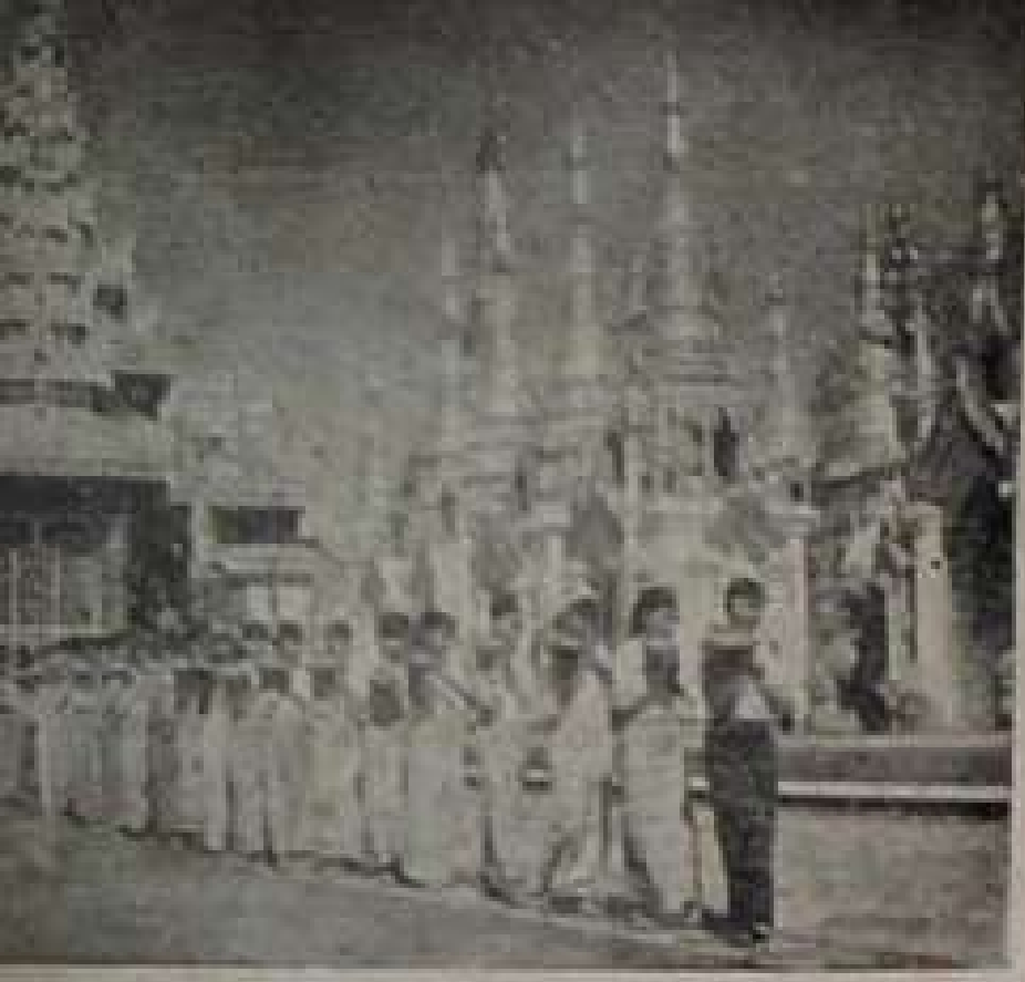
ကုသိုလ်ရေး ဆိုလျှင်လည်း အမျိုးသမီးများက ရွှေတန်းက။ ကဆုန်ညောင်ရေသွန်းကြမည့် အမျိုးသမီးတစ်ဦး။