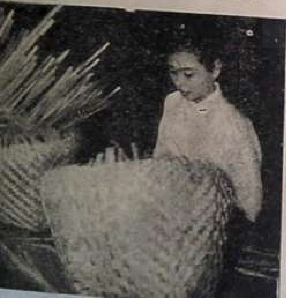
ထူဘောင် ခေတ်ဦးပိုင်းကပင် အပျိုးသမီးများ လုပ်ကိုင်ခဲ့ကြသောခြင်းများ။ တောင်များ ရက်လုပ်ခြင်းကို ယခုလည်း အပျိုးသမီးများလုပ်ကိုင်ဆဲ။