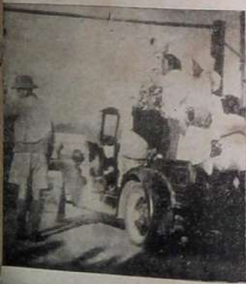
သပိတ်ကိစ္စအတွက် အမင်းခံရလျှင်လည်း ပျော်ပျော်ပါးပါး နှစ်လိုက်ပါသွားကြသည်။