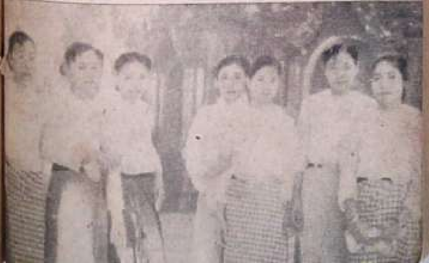
၁၉၃၆ ခုနှစ် တက္ကသိုလ်သပိတ်ကိစ္စတွင် ပါဝင်ခဲ့ကြသော အပာခံ တက္ကသိုလ် ကျောင်းသူတစ်ဦး။