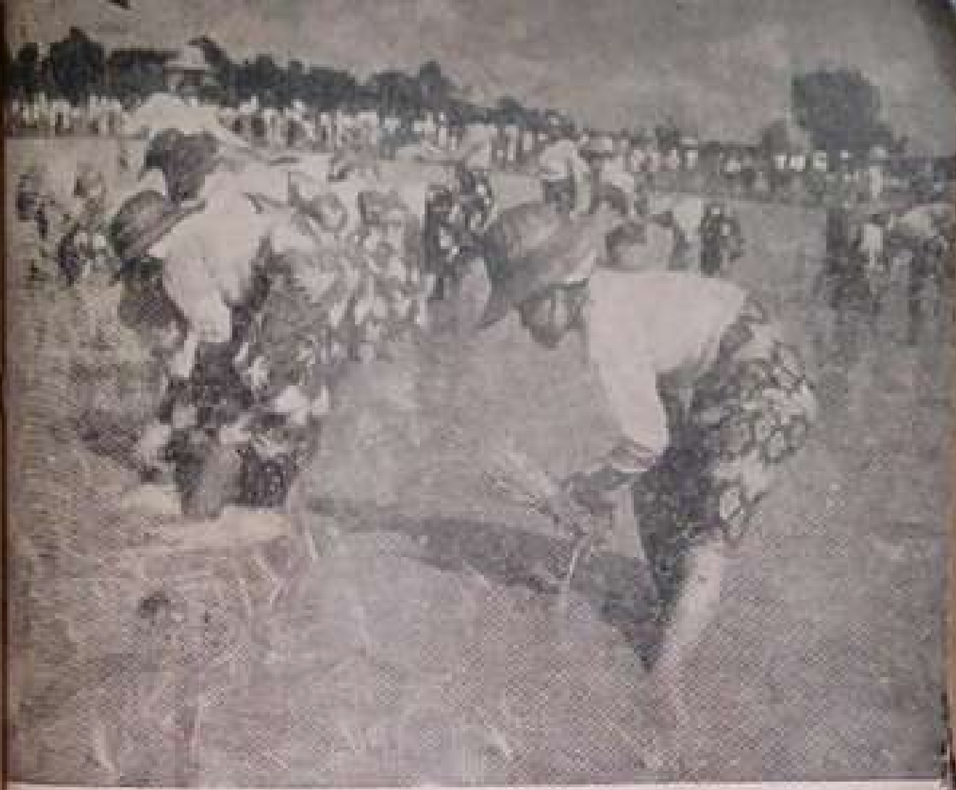
နိုင်ငံတော်တက္ကသိုလ် ဝိုက်ပျိုးရေးဘက်တွင်လည်း အမျိုးသမီးများပပါလျှင်ပပြီး။

ကနည်း စသည်တို့ကို ဆည်းပူးခဲ့ရ၍ ဆို-က-ရေး-တီး အနုပညာသို့ဖြင့် ကုလုံကြယ်ဝသော အနုပညာရှင်ကြီး တဆူဖြစ်လာပြီး ဂီတလောကတွင် ဂီတမိခင်ကြီးအဖြစ် လေးစားနေရာထားခြင်း ခံခဲ့ရလေသည်။ သီဆိုမှုတွင် “နုရည်” ခေါ် ဝည်းဝါကို အလွန်နှိုင်းသွား၍ “နုရည်ကောင်းသ” ဟု ဆိုစေတတ်ပြုကြသည်။ သီချင်းများစွာရေးစပ်ခဲ့သည့်အနက် “မိုးဝေဝါ”၊ “လမ်းသော်တာ”၊ “မိုးပဇ္ဇာန်” ပတ်ပျိုးများကား စာသားအဖွဲ့အဖွဲ့ ကောင်းသည်သာမက အသံများကလည်း လွန်စွာ ယဉ်ကျေးသာယာလှပေသည်။ ခေါ်စောမြေကြည်သည် ဂုဏ်ယုကမ္ဘာလုံးပထိုက်မီကလေးက အစိုးရပန်းချီနှင့် ဂီတပညာကျောင်းတွင် အဆိုနည်းပြဆရာအဖြစ် ဆောင်ရွက်ခဲ့သည်။ စစ်ပြီးခေတ်တွင် မီးရထားဘူမိ၏ တာဝန်ပေးချက်အရ မြန်မာဂီတ မြန်လည်ထွန်းကားရေးကို တာဝန်ယူဆောင်ရွက်ခဲ့ရသည်။ သီချင်းကြီးပျောက်အဖွဲ့၏ အဖွဲ့ဝင်တဦးလည်းဖြစ်ခဲ့သည်။ ၁၉၅၂ ခုနှစ်တွင် မြန်မာနိုင်ငံအစိုးရက အလင်္ကာကျော်စွာအဖွဲ့ဖြင့် ချီးမြှင့်သည်။ ၁၉၅၁-၅၇ ခုနှစ်အထိ ကံဘဲဆရာအတတ်သင်ကျောင်း၌ ဂီတနည်းပြအဖြစ် ဆောင်ရွက်နေစဉ် ရန်ကုန်တက္ကသိုလ်က ဂုဏ်ထူးဆောင်ဘွဲ့အားကို ပေးအပ်ခြင်း ခံယူရလေသည်။ ထို့နောက် သမိုင်းကောင်းစွာ၌ မြန်မာဂီတဆုတော်အဖြစ် အမှုထမ်းစဉ် ကွယ်လွန်ခဲ့လေသည်။ ခေါ်စောမြေကြည်နှင့် မရေးမနေဘဲ ကျော်ကြားလာသူ သီချင်းကြီးအဆိုတော်ကြီးတဦးမှာ ခေါ်စောလီညွန့် ဖြစ်သည်။ ခေါ်စောလီညွန့်သည်လည်း သီချင်းကြီးနယ်တွင် ဆရာကြီးတဆူပင်ဖြစ်သည်။ ညောင်ပုံများ၌ နေ့စားဖြင့် ဆိုင်ဆိုင်ခြင်းကို ခေါ်စောလီညွန့်က အပြုခဲ့သည်ဟု ဆိုကြသည်။