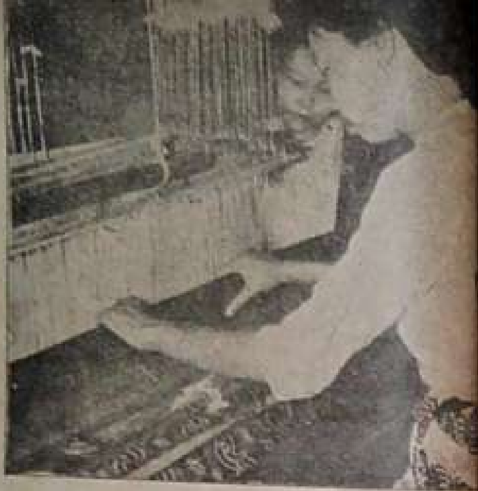
ဝယ်စားဆင်ယင်ကြရေးအတွက် ငွေပဝေစီကစပြီး ယခုတိုင်ဘောင်အပျိုးသမီးများက ရက်လုပ်ပေးနေရလျက်ပင်။