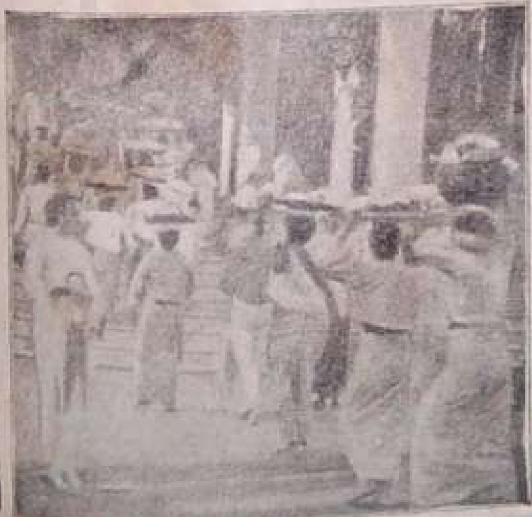
သပိတ်ခရီးသို့ ထမင်းထုပ်သွားပို့ကြသူများ၊ ရိက္ခာပို့ကြသူများမှာ ကျေးသမီးများသာ။