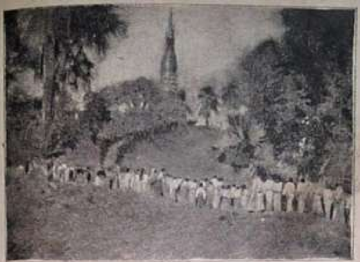
သပိတ်တရားပွဲသို့ သွားကြလျှင်လည်း ကျေးသမီးများက အပျားစု။