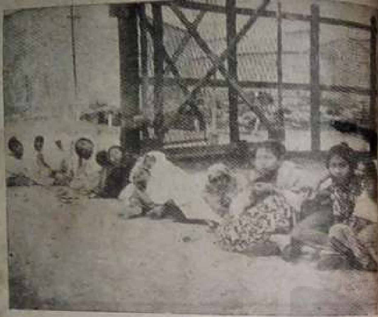
ရန်ကင်းသပိတ်တွင် ကျေးသမီးများက သပိတ်လည်း တားခဲ့ကြသည်။