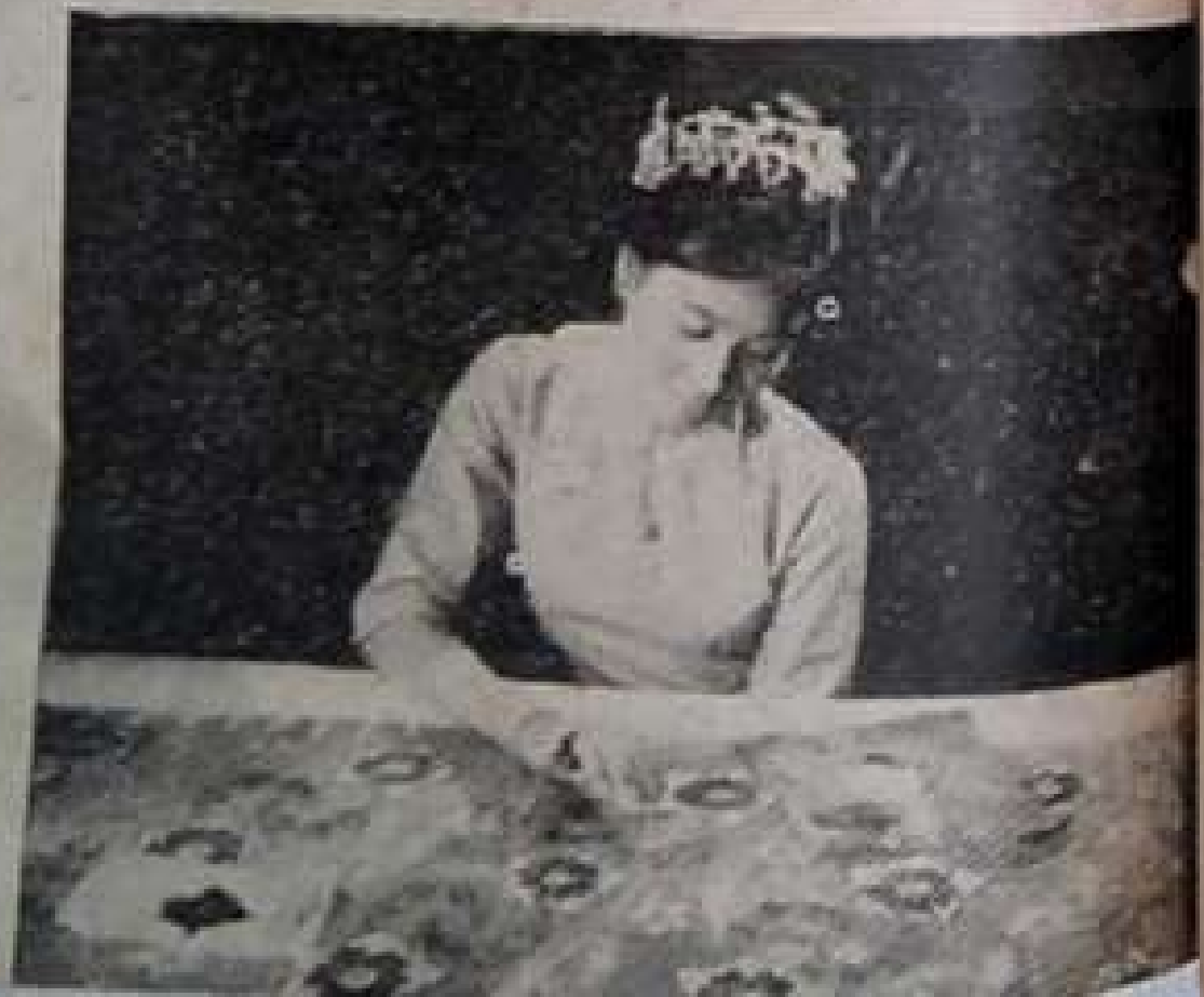
လှလှပပ ပိုင်ခွင့်ချုပ်လုပ်ရသော ရွှေချည် ငွေချည်ထိုးခြင်းသည် အမျိုးသမီးများ ပိုင်နိုင်သော အချုပ်အလုပ်အမျိုး။