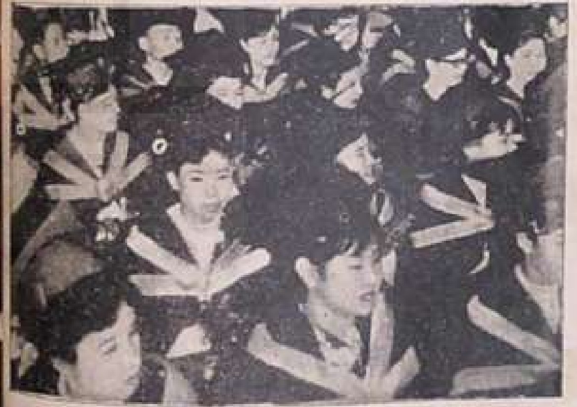
ဆရာမ အမျိုးသမီးများ၏ ဦးရေကလည်း နှစ်စဉ် အများစုပြား တိုးတက်နေသည်။