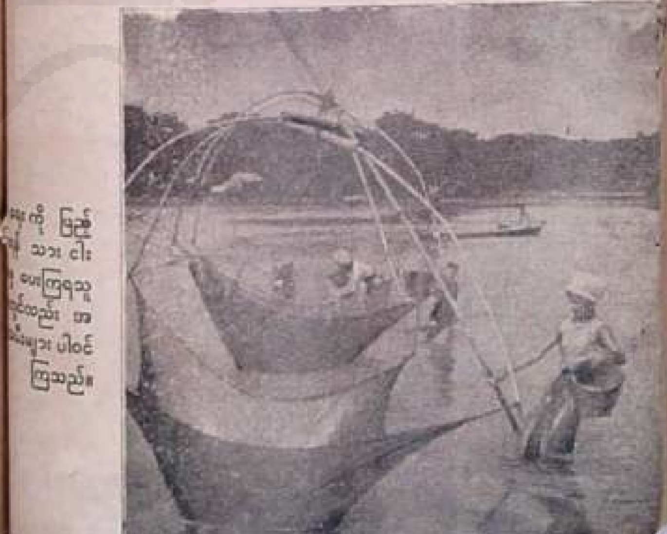
အမျိုးသမီးများကို ဖြည့်သား ငါးဖမ်းကြရသူ ညောင်ပုံများ အမျိုးသမီးများ ပါဝင်ကြသည်။