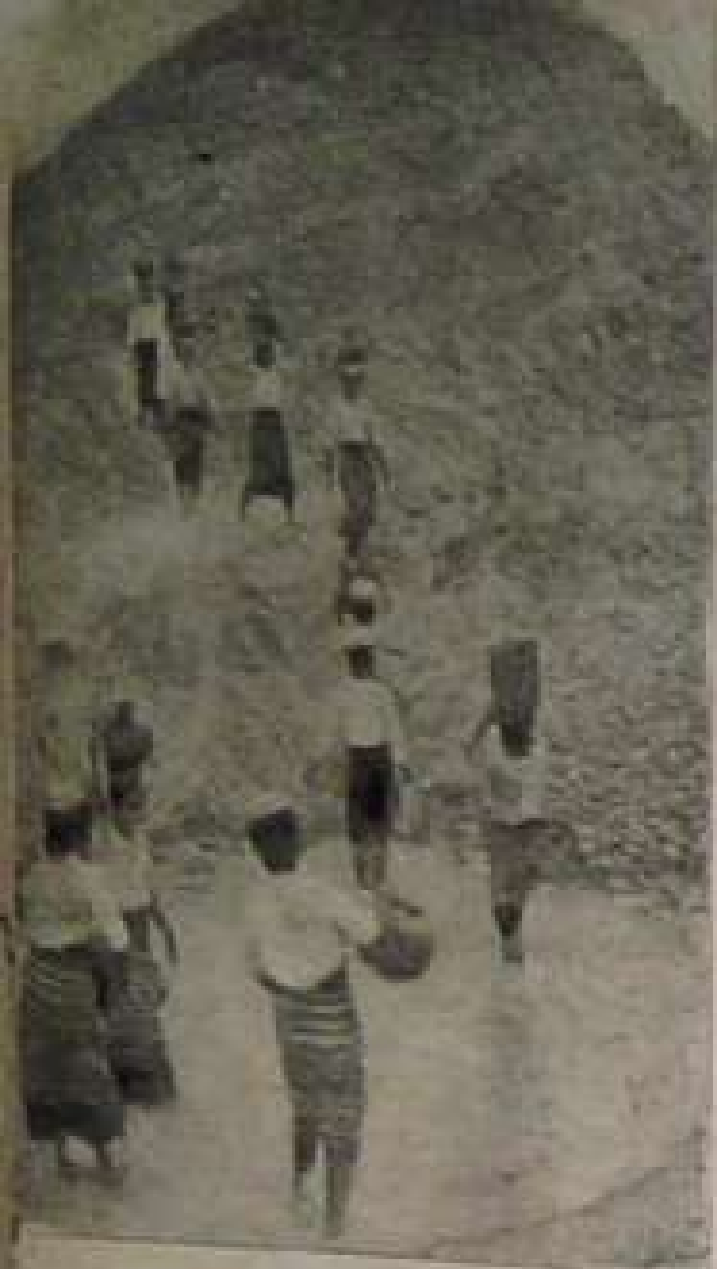
နိုင်ငံအတွက် လူလူအတွက် အကျိုးပြုမည် လုပ်ငန်းကြီး များတွင်လည်း အမျိုးသမီး များပါဝင်ပြုတူရှင်ဆောင်ရွက် အတွက် အမျိုးသမီးများ လုပ်အားပေးနေကြောင်း။