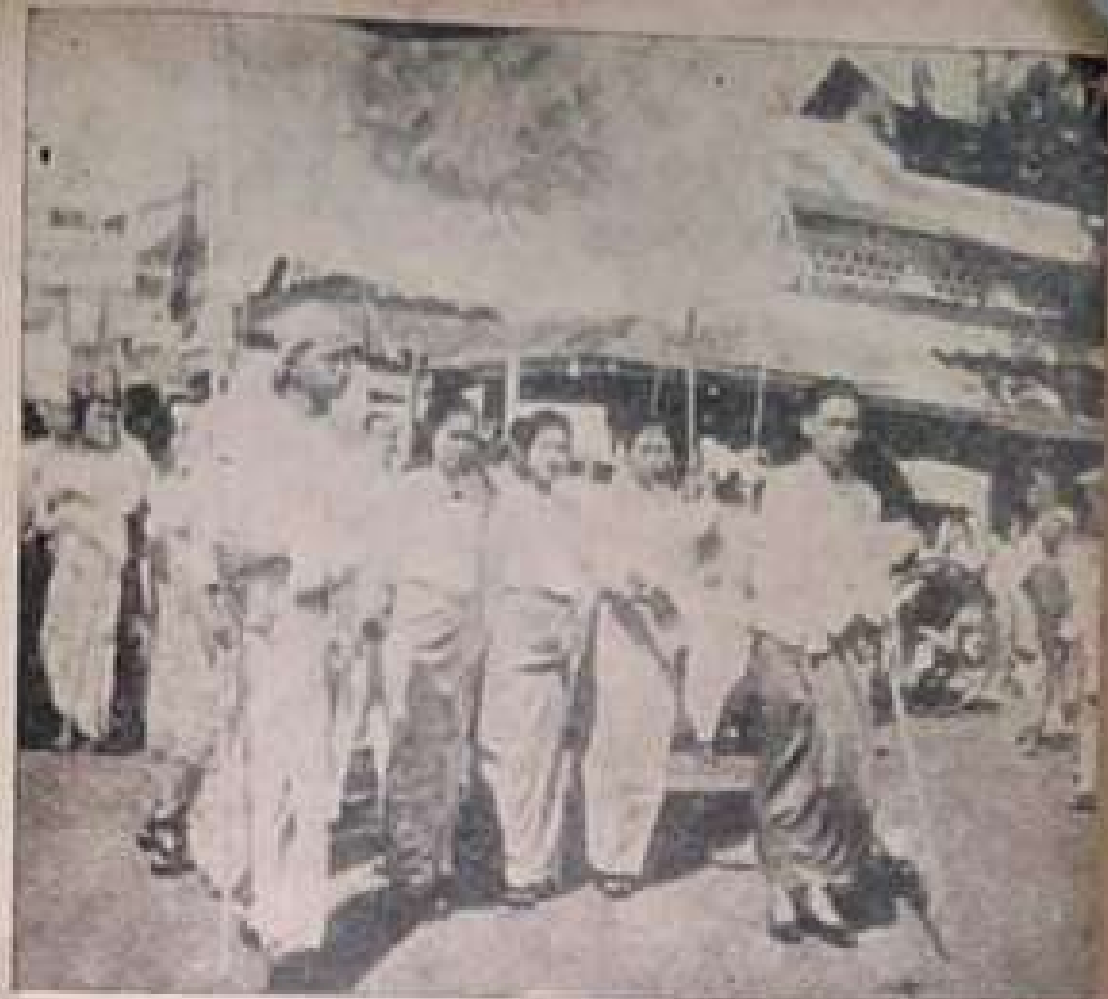
ဝု-ကမ္ဘာစစ်ပတိုင်မီက ပျိုးချစ်စိတ်နှင့် နိုင်ငံချစ်စိတ်ကို လှုံ့ဆော်ပေးသော အပျိုးသားနေ့ လှည့်ပွဲတွင် ပါဝင်ခဲ့ကြသော တက္ကသိုလ် ကျောင်းသူများ။