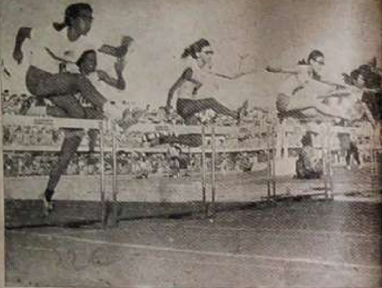
ရှေးခေတ်က သိပ်သိပ်ပေပေနေမှ ပိန်းပပီသသည်ဟု ယူဆခဲ့ကြသော်လည်း ခေတ်နှင့်အညီ ကမ္ဘာ့အမျိုးသမီးများကို အမှီလိုက်၍ ခုန့်ပျံကျော်လွှား နိုင်သော အားကစားပယ်များလည်း ထွန်းကားလာခဲ့ပြီ။