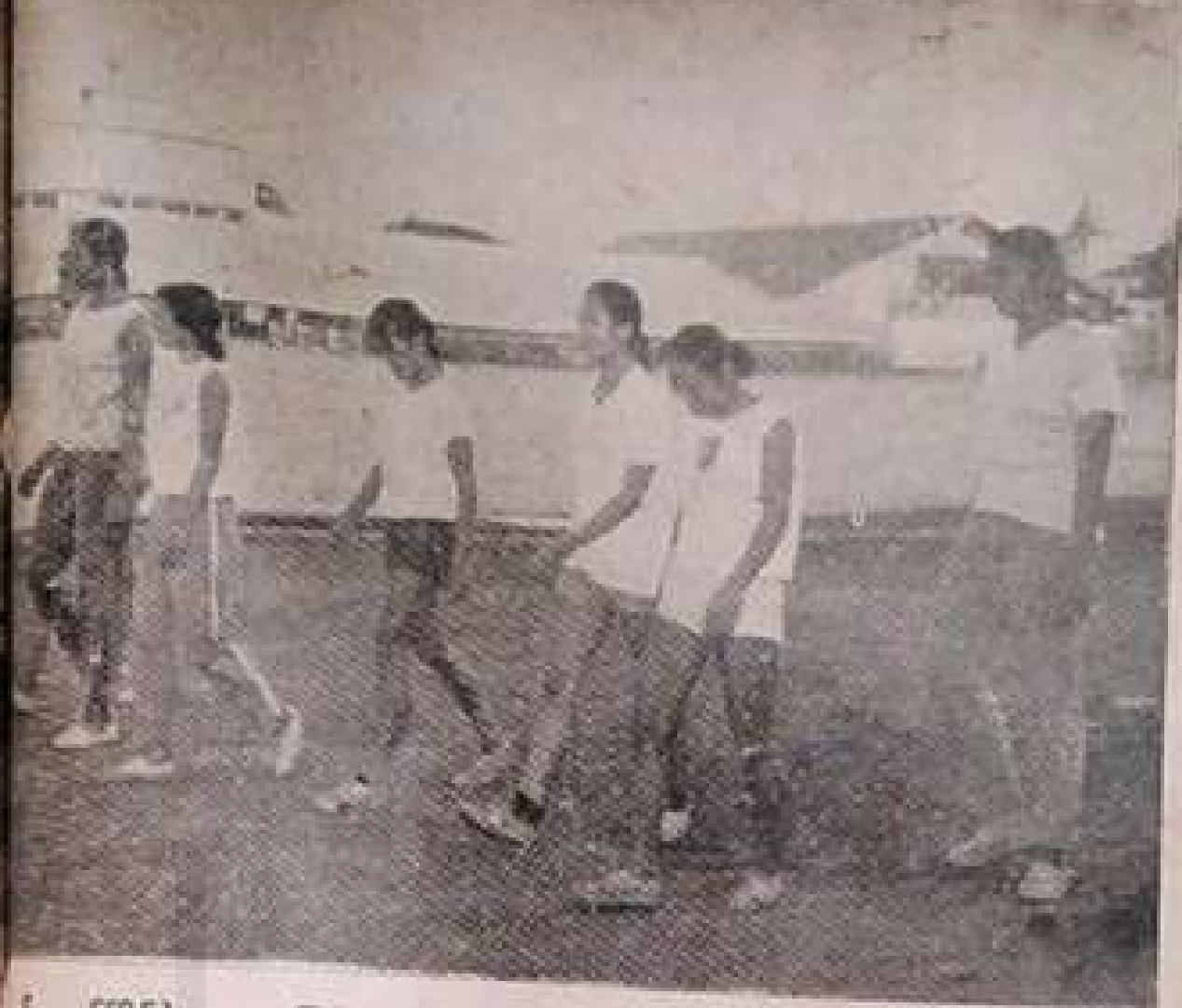
အမျိုးသမီးပြိုင်ပွဲများမှ မြန်မာ့ကုန်ထူးဆောင် အားကစားပယ်များ။