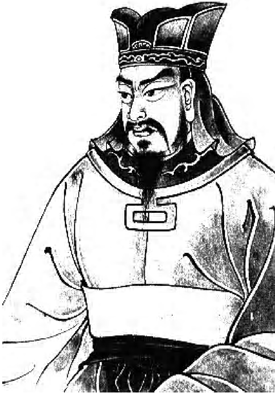
စစ်ရေး သေနင်္ဂဗျူဟာပညာရှင် ဆွန်ဇု