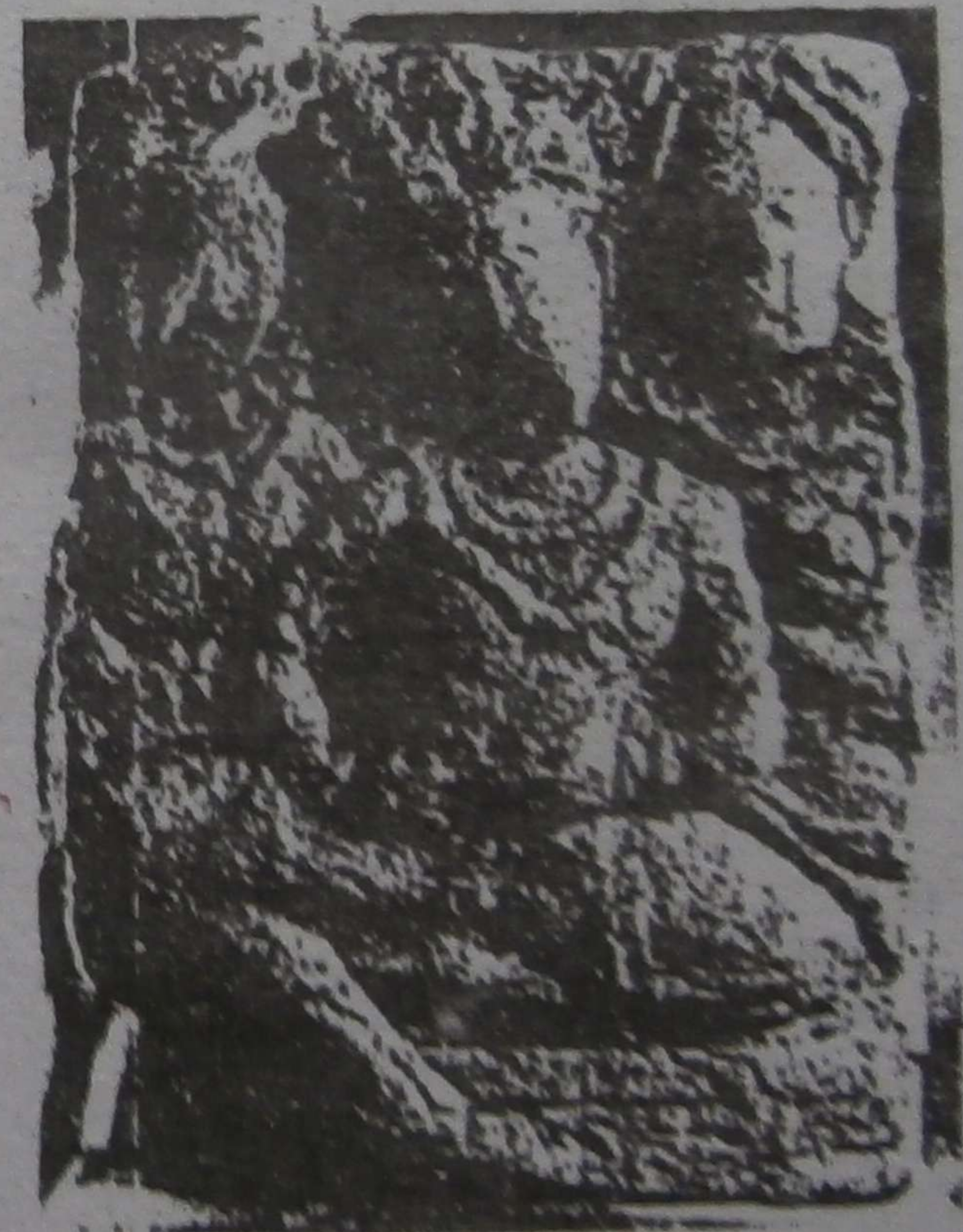
မွန်ပြည်နယ်မှ ရှေးဟောင်းဂဝံကျောက်လက်ရာများ